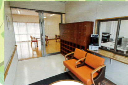
玄関 Entrance 玄関脇には事務室がありますので、来所の際にはお声をおかけください。