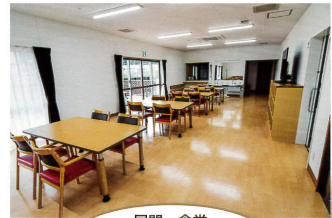
居間・食堂 Day room & Dining 食事やレクリエーション、様々な季節に合わせた行事等、利用者様が楽しく過ごすことを目的とし、ウッドデッキがあることで、開放感を感じられる空間となっております。