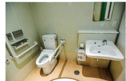
トイレ Toilet 車いすでも十分な広さのトイレです。