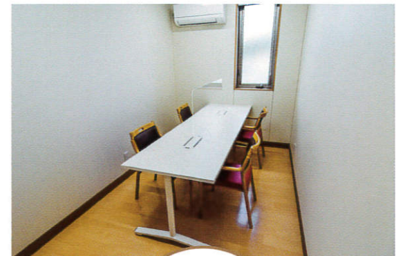
相談室 Counseling room 利用者様やご家族様の介護に関する心配事など介護支援専門員を中心としたスタッフが様々なご相談に対応いたします。プライバシーを確保した空間となっておりますのでお気軽にご相談ください。