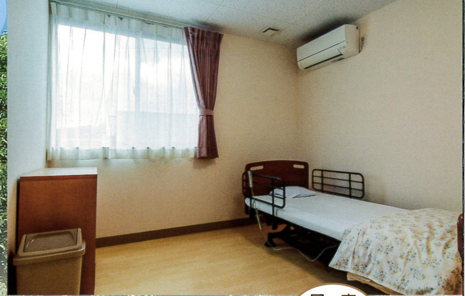
居室 Living room 6居室あり、6名様まで宿泊できます。