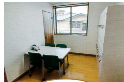
スタッフルーム Staff room 職員のミーティングの場として使用します。