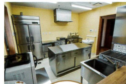
厨房 Kitchen room 季節感を味わえる食事を提供します。